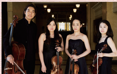
カルテット・アマービレ

ららら♪クラシックコンサート Vol.7 「ベートーヴェン特集」～生誕250周年に寄せて～ 2020年1月19日(日)14:00開演(13:30開場) 会場 Bunkamura オーチャードホール